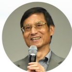
林萬億 行政院 政務委員